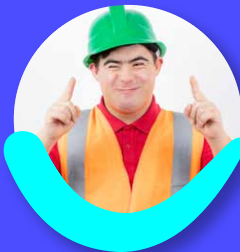
Personas en condición de Discapacidad