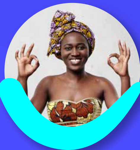
Mujeres Víctimas de la Violencia

Su empresa recibe beneficios tributarios y económicos cada vez que contrata a: